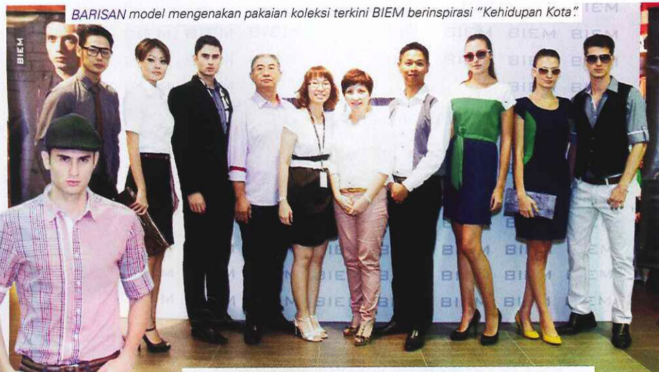
BARISAN model mengenakan pakaian koleksi terkini BIEM berinspirasi "Kehidupan Kota"