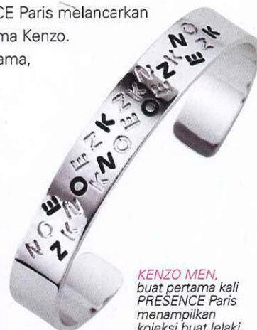
KENZO MEN , buat pertama kali PRESENCE Paris menampilkan koleksi buat lelaki.