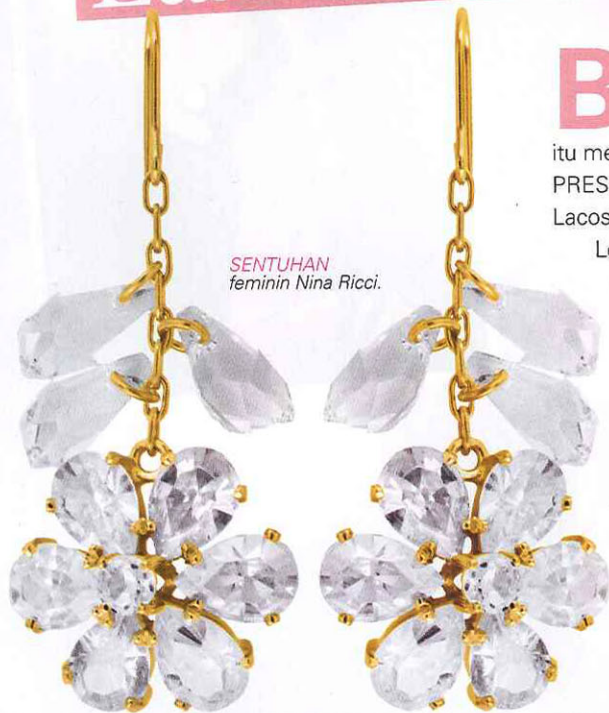
SENTUHAN feminin Nina Ricci.

Seleksi barangan direka tanpa mengira batas tradisi, ikonik dan juga fesyen terkini. Tawaran terkini dari PRESENCE Paris ini bakal menyerikan lagi penampilan para wanita dengan gabungan unsur elegan, feminin dan trendy pada barangan kemas dan juga jam tangan.