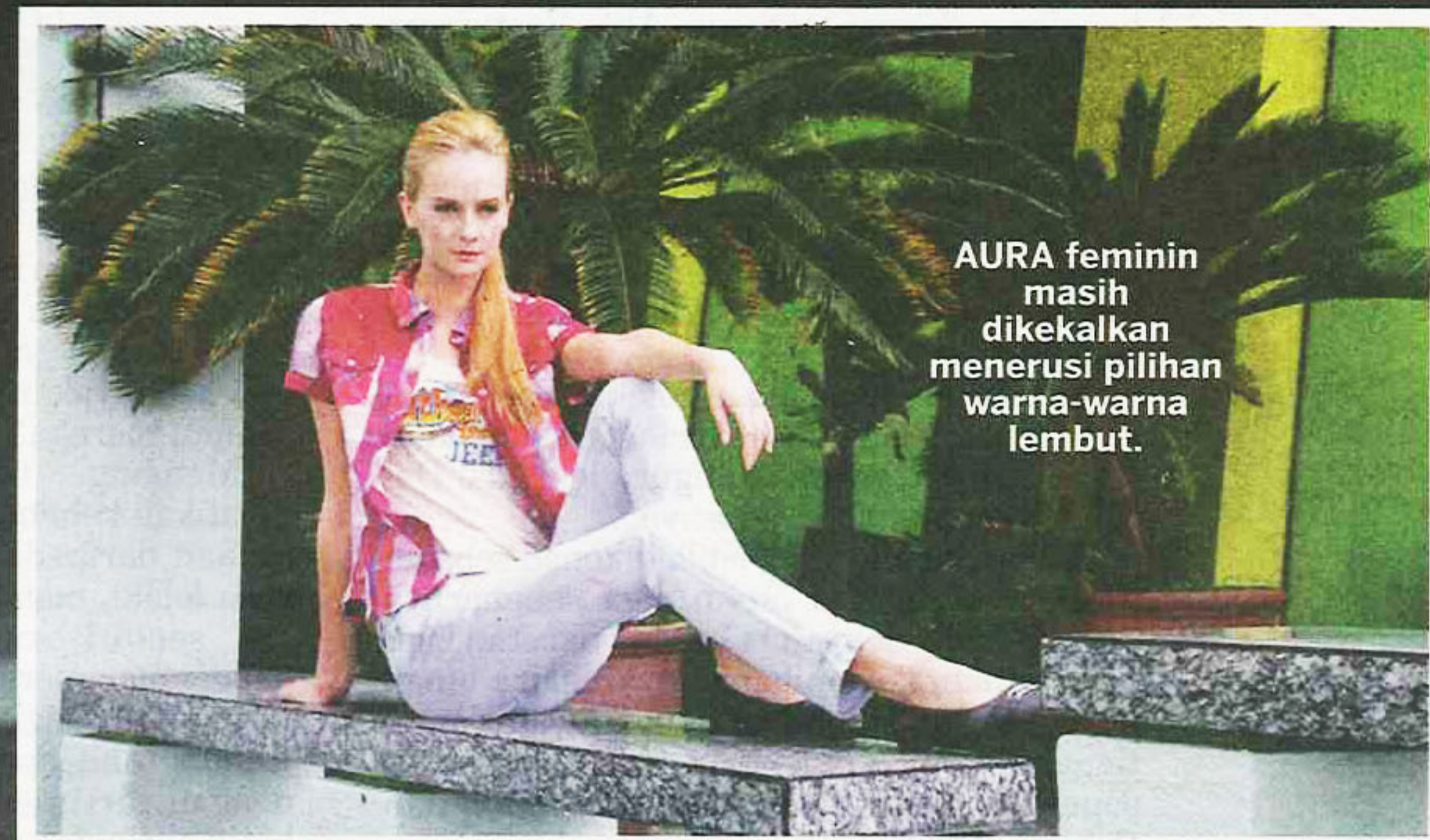
AURA feminin masih dikekalkan menerusi pilihan warna-warna lembut.