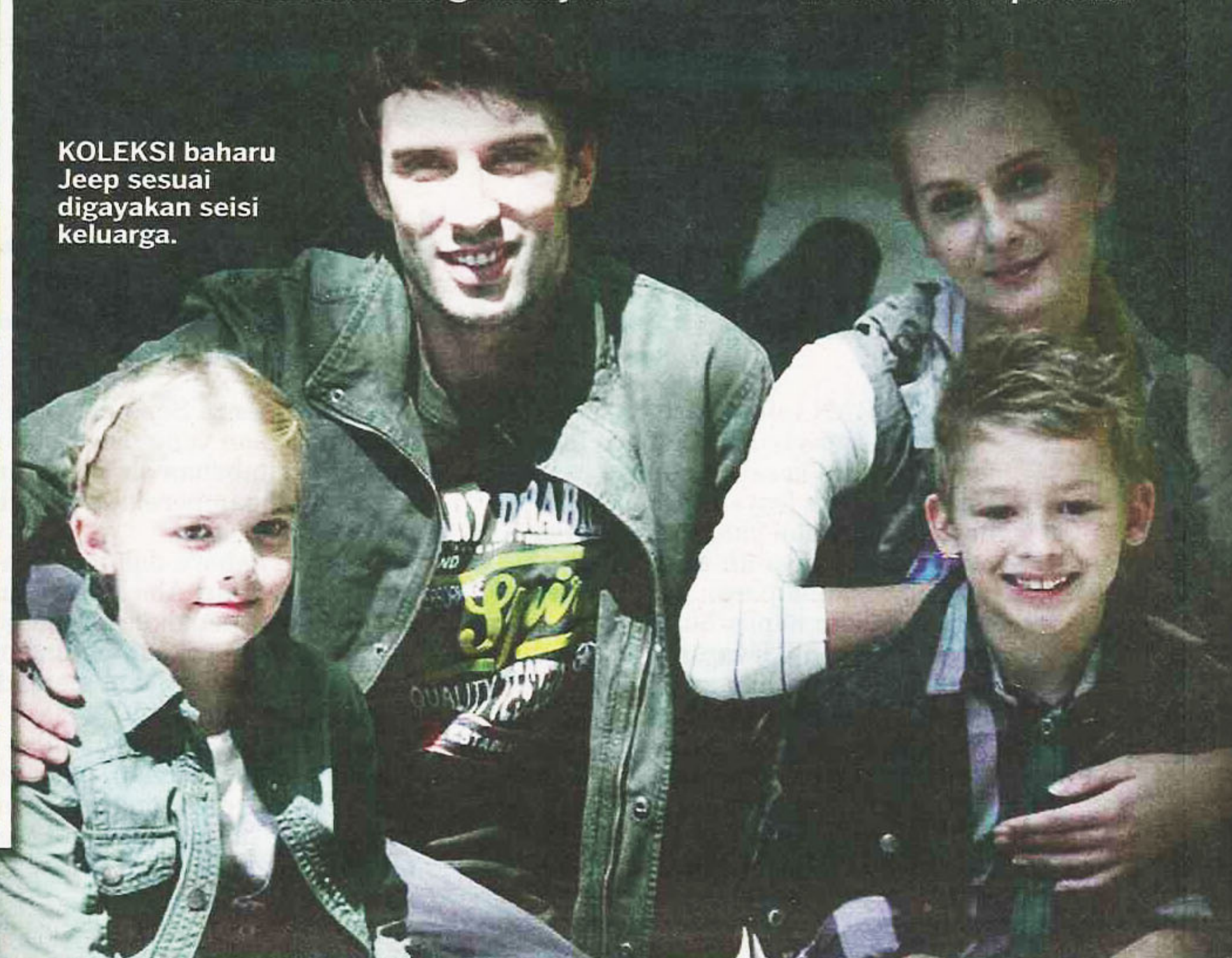
KOLEKSI baharu Jeep sesuai digayakan seisi keluarga.