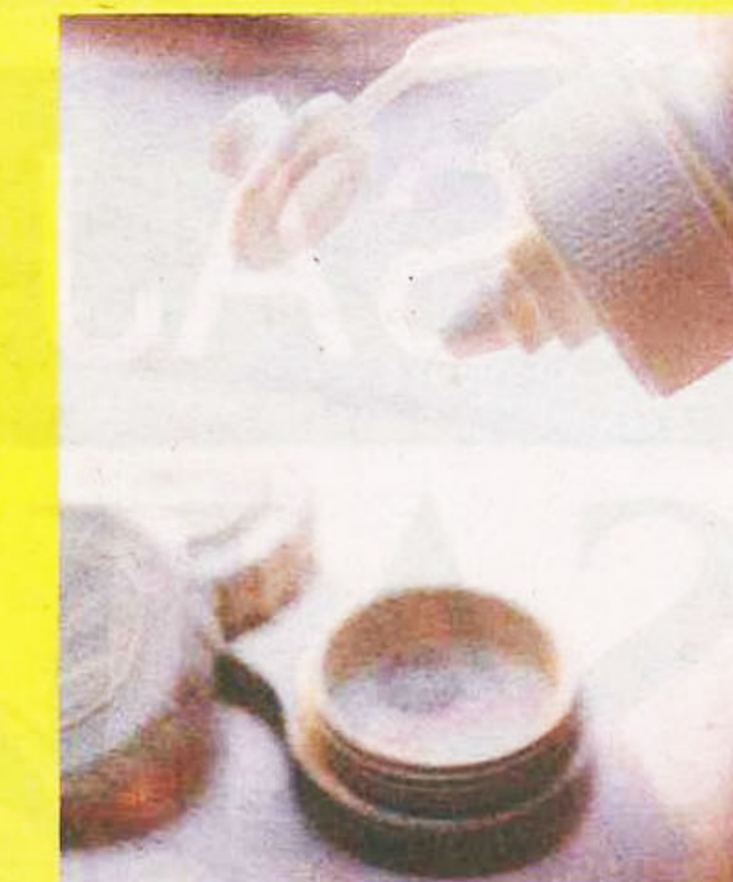
CECAIR yang betul penting bagi mengekalkan kebersihan kanta lekap.

Sebelum memakai kanta lekap, pemakai harus mencuci tangan terlebih dahulu sebelum memegang dan meletakkannya ke atas anak mata. Tangan yang kotor boleh mengakibatkan infeksi pada mata akibat kotoran atau kuman yang terlekat pada kanta lekap. Jika mata menjadi kemerahan dan bengkak selepas memakai kanta lekap, digalakkan untuk menanggalkannya terlebih dahulu. Cuci dengan cecair yang diberikan dan rendamkan untuk beberapa ketika sebelum memakainya semula.