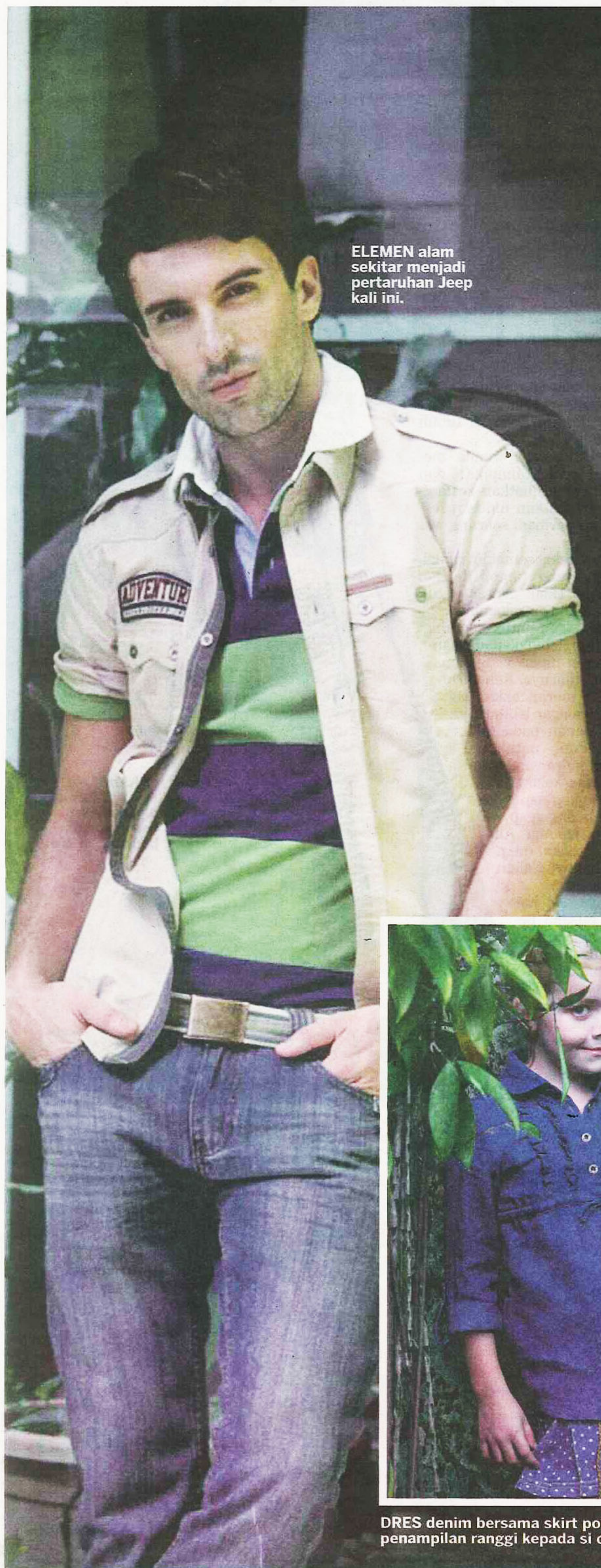
ELEMEN alam sekitar menjadi pertaruhan Jeep kali ini.