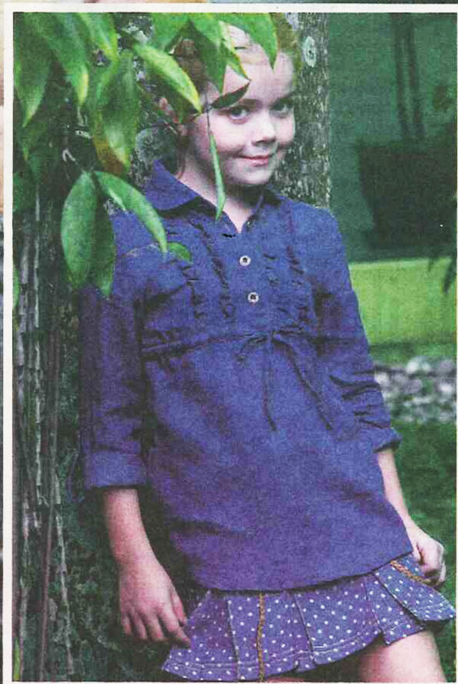
DRES denim bersama skirt polka dot ini memberi penampilan ranggi kepada si cilik.

Label Jeep Apparel boleh didapati pada harga yang berpatutan iaitu antara RM69 hingga RM399 di beberapa pusat beli-belah utama seperti AEON Cheras Selatan, KL Festival City, AEON Tebrau City dan City Square.