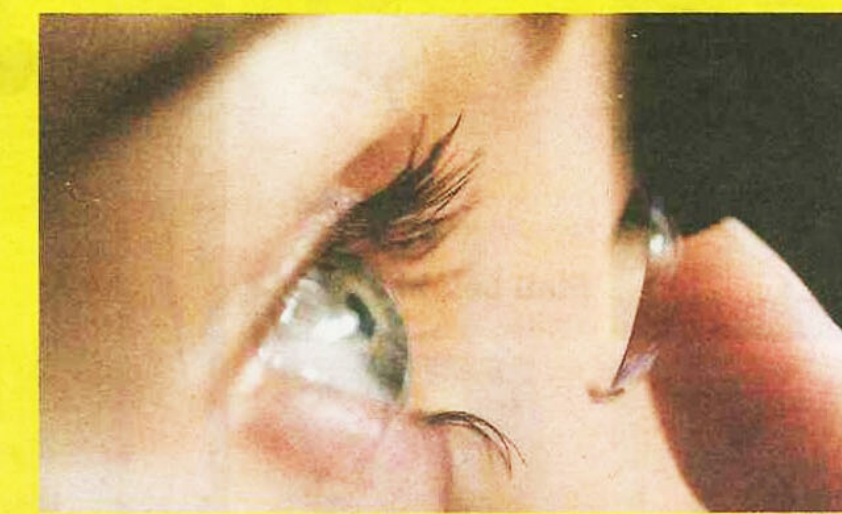
PASTIKAN tangan anda dalam keadaan bersih sebelum kanta lekap dipasang pada mata.