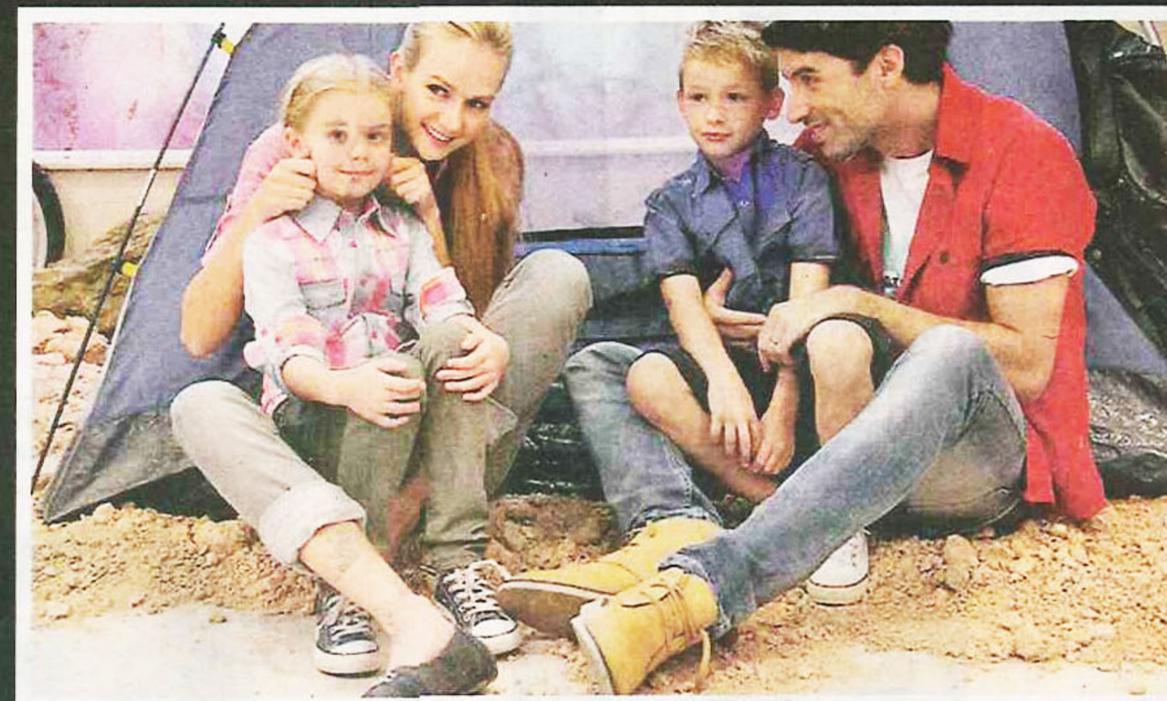
SEMUA pakaian Jeep musim ini sesuai disarungkan ketika melakukan aktiviti lasak.