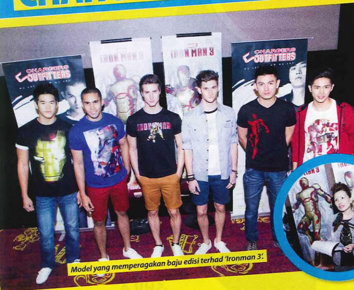
Model yang memperagakan baju edisi terhad 'Ironman 3'.