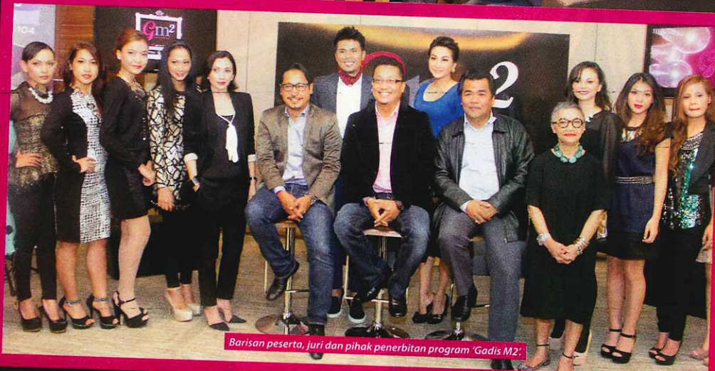
Barisan peserta, juri dan pihak penerbitan program 'Gadis M2'.