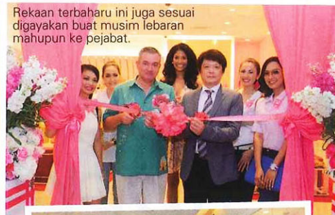
Rekaan terbaharu ini juga sesuai digayakan buat musim lebaran mahupun ke pejabat.