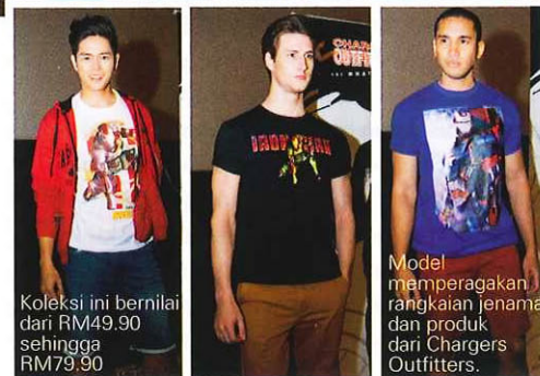
Koleksi ini bernilai dari RM49.90 sehingga RM79.90